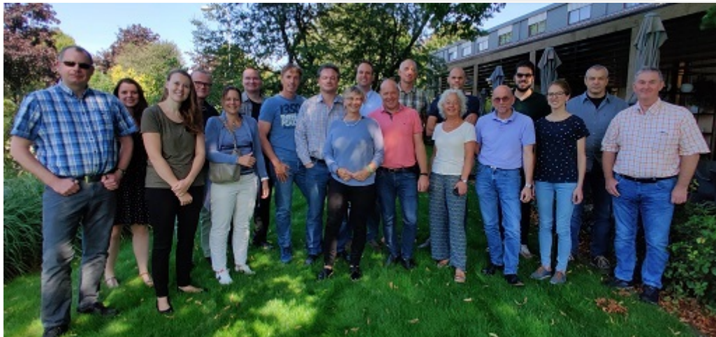
Deelnemers eerste Summer school Arbeid en Gezondheid 2019